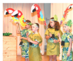
Fête de l'école