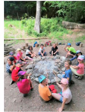
Le camp au Creux-des-Biches, la journée de ski, les après-midis en forêt, les sorties à la patinoire