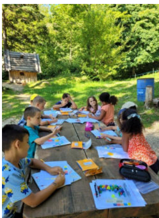
Diverses activités à l'extérieur