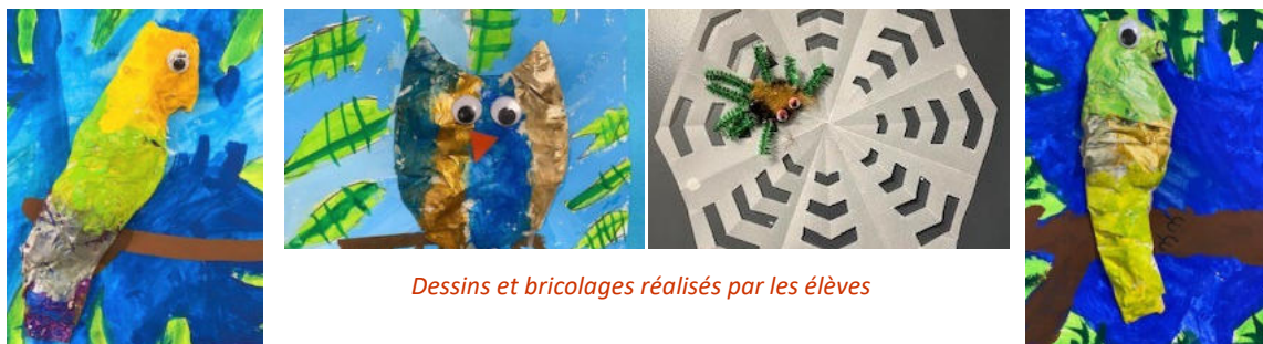
Dessins et bricolages réalisés par les élèves

Ces absences ne sont pas mentionnées dans le bulletin scolaire.